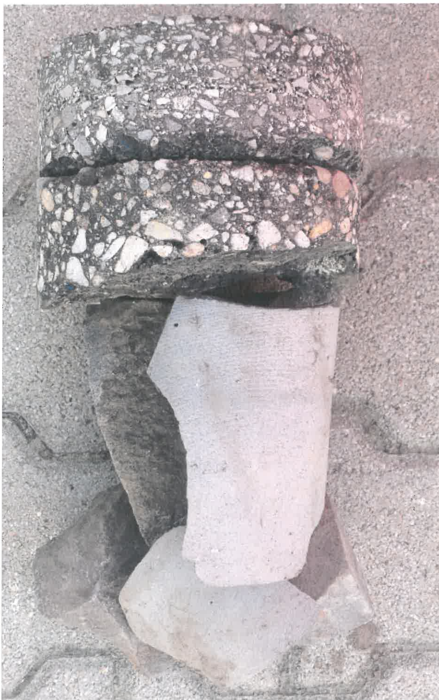
2. kép: Fúrt minta Nyíregyháza, Körte utca 28-30. szám telekhatár tengelytől 1,8 m