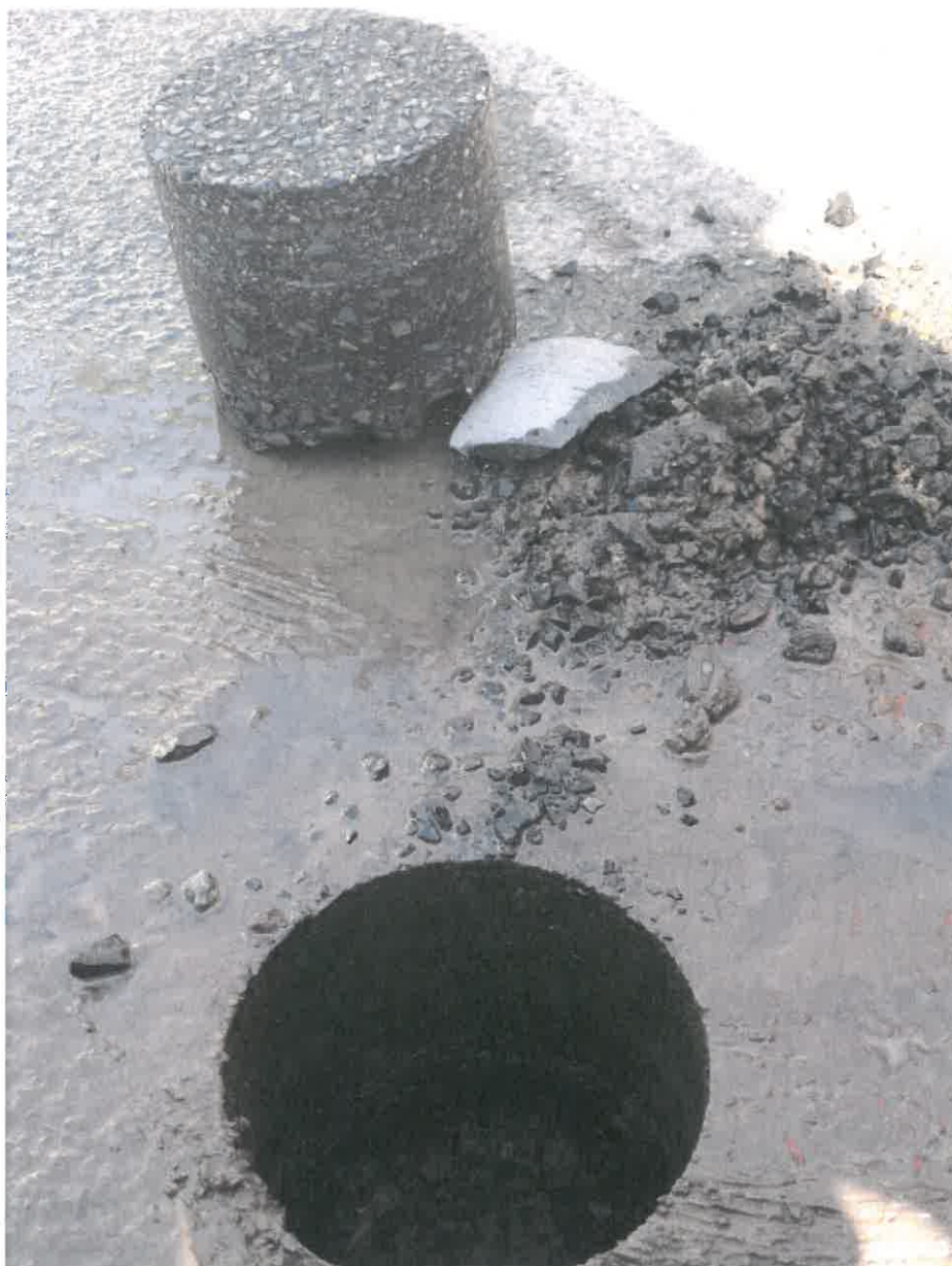
3. kép: Fúrást követően Nyíregyháza, Körte utca 19. szám előtt tengelytől 1,9 m

Rétegfelépítés: 52 mm aszfaltbeton kopóréteg (11 mm szemnagyság) 61 mm aszfaltbeton (11 mm szemnagyság) 33 mm aszfaltbeton (11-16 mm szemnagyság) kb. 110-115 mm rakottkő/zúzottkő alapréteg Tükörszint (homok talaj)