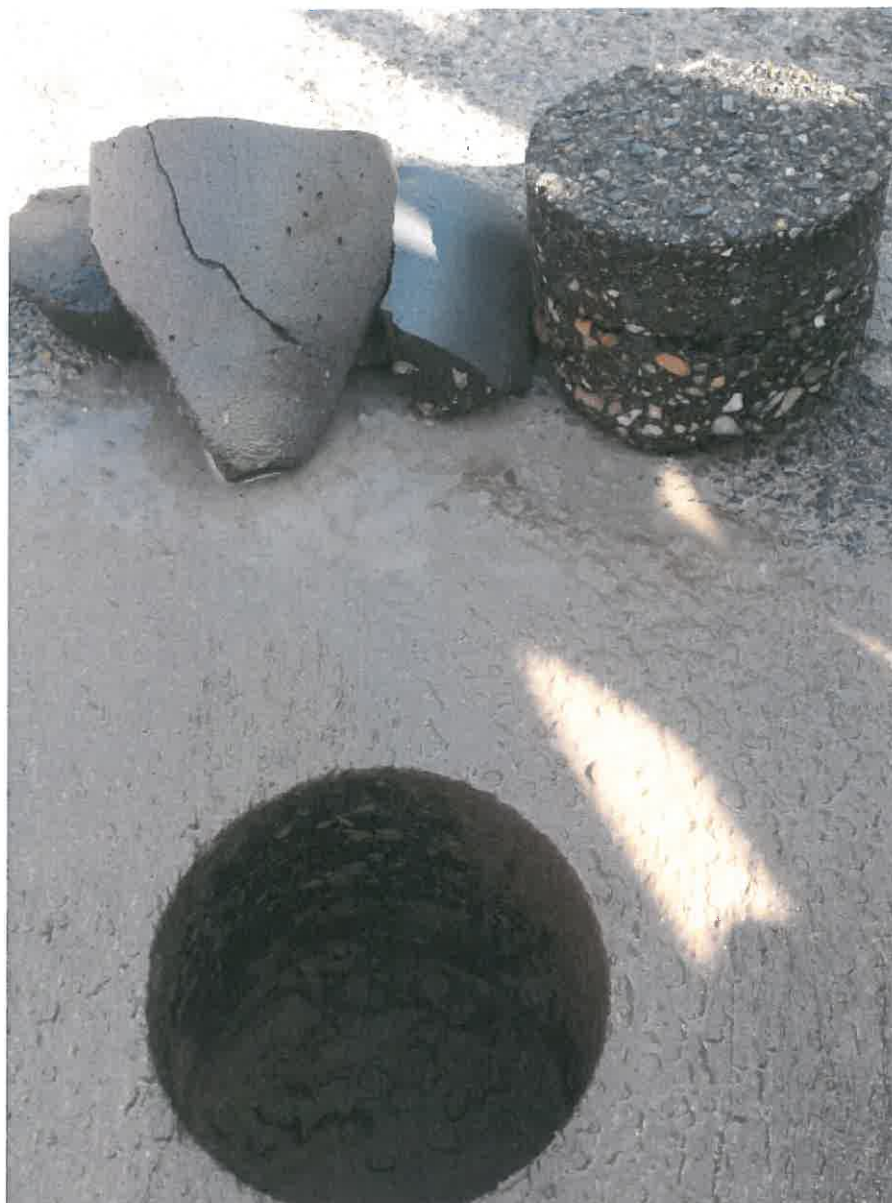
1. kép: Fúrást követően Nyíregyháza, Körte utca 28-30. szám telekhatár tengelytől 1,8 m

Rétegfelépítés: 28 mm aszfaltbeton kopóréteg (8-11 mm szemnagyság) 22 mm aszfaltbeton (11 mm szemnagyság) 35 mm aszfaltbeton (16 mm szemnagyság, kavicsaszfalt) kb. 105-110 mm rakottkő alapréteg Tükörszint (homok talaj)